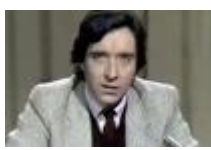
En Sevilla y en TVE